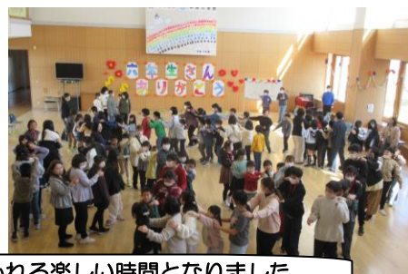
たてわり感謝の会、6年生を送る会。どちらも、笑顔あふれる楽しい時間となりました。