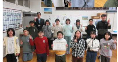
Webマラソンの表彰をしていただきました。