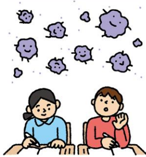
空気感染(飛沫核感染)