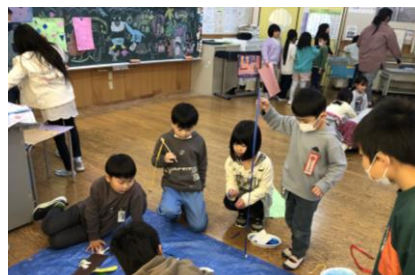
【18日 5年環境教育出前授業】 【19日 音楽アウトリーチ事業】 【20日 2年おもちゃまつり】