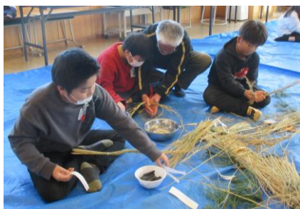
【5年 しめ縄づくりより】

さて、明日から始まる冬休みでは、年末年始の伝統的な行事をお子さんと一緒に行い、経験させ、その意味も併せて教えていただきたいと思います。特に、大掃除などは、お子さんが家族の一員として活躍できるよい機会となります。やり方を教え、手伝いをどんどんさせ、できたことはたくさん褒めてあげてください。ご家族からの「助かったよ。」「ありがとね。」などの言葉は、お子さんの心を耕し、家族を喜ばせたいという気持ちを育て、それはやがて人のために役立つ行動をしようという意欲につながっていきます。子供たちが新しい年へ向けて、働く喜びを感じ、力強い抱負が持てるような冬休みになることを期待しております。