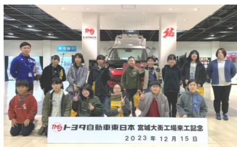
【12日 3年校外学習（消防署）】 【13日 児童集会（健康委員会）】 【15日 5年校外学習（トヨタ）】