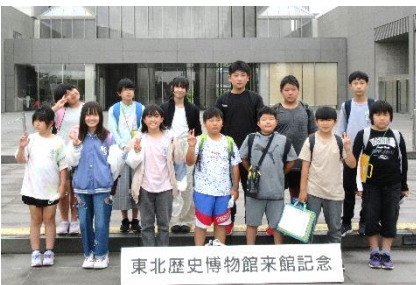
東北歴史博物館来館記念